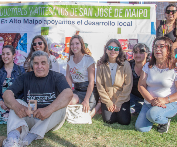
En la oportunidad, 20 artesanos de San José de Maipo exhibieron sus creaciones destacándose las producciones en cuero, mermeladas, tejidos, jabones, joyas, textiles, chocolates, entre otros.

Los 20 artesanos exhibieron sus múltiples creaciones elaboradas a mano, teniendo como sello la identidad local del Cajón del Maipo, en tres stands del FIIS, destacándose sus creaciones en tejidos, jabones, joyas, producciones en madera, textiles, chocolates, cuero, entre otros.