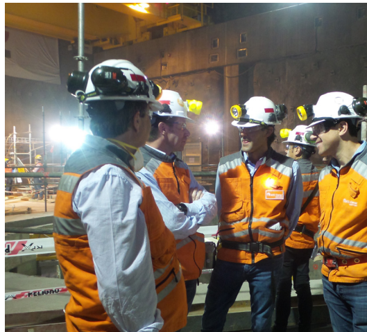
Las obras de Alto Maipo presentan un total de avance del 75%.

Las obras de Alto Maipo, el principal proyecto hidroeléctrico de pasada que se construye en el país que aportará con 531 MW de energía segura y sustentable, presentan un de avance total de 75%.