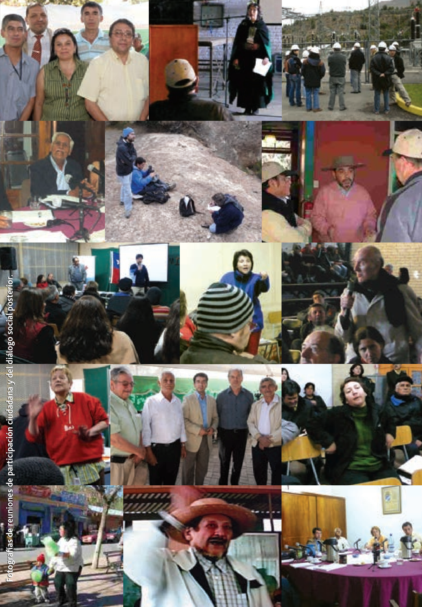
Fotografías de reuniones de participación ciudadana y del diálogo social posterior.