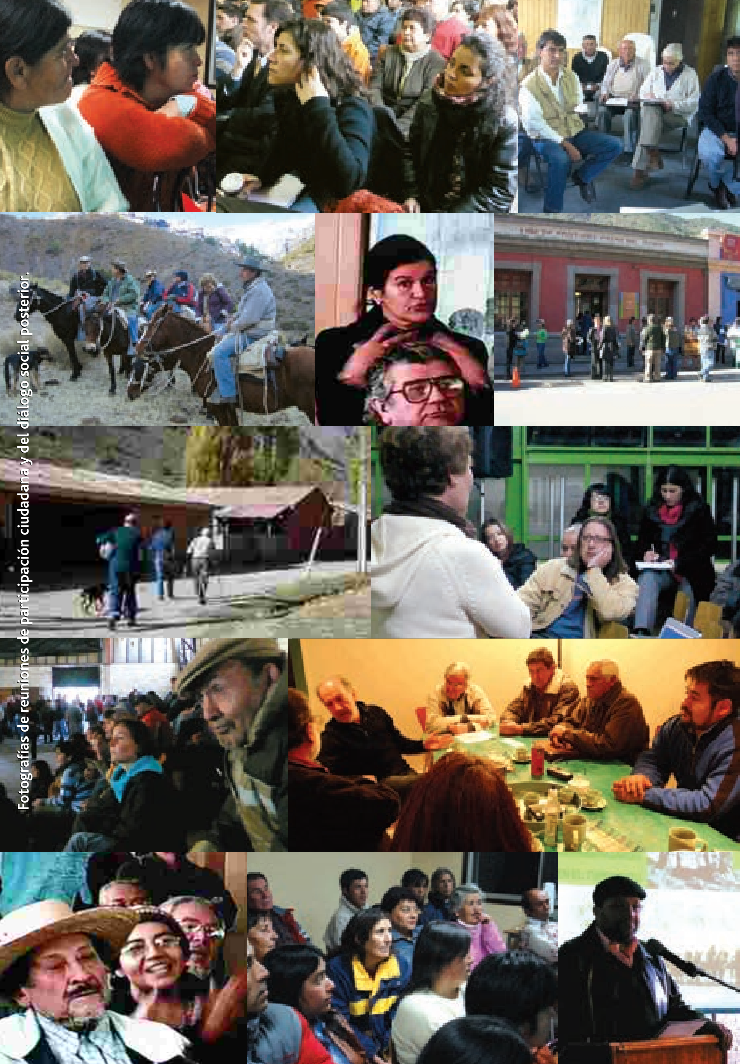
Fotografías de reuniones de participación ciudadana y del diálogo social posterior.