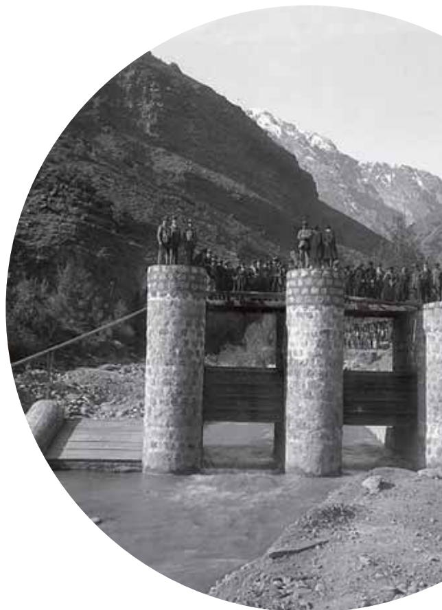
Construcción Central Maitenes, en operación desde 1923

Los invitamos a que tomen este boletín como una fuente de información tanto para conocer los detalles de la Central de Pasada Alto Maipo como los beneficios locales asociados a la construcción del proyecto.