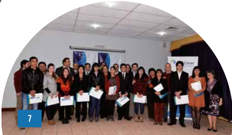
Estudiantes beneficiarios, alcalde y concejales de la comuna, junto a ejecutivos de AES Gener.