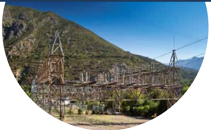
Subestación Las Lajas