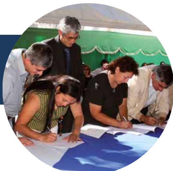
Firma del Convenio Social, 2009