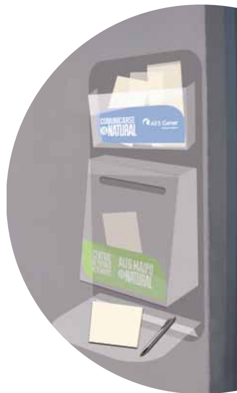
Buzón de comunicación

AES Gener quiere seguir conversando con ustedes y conocer su visión acerca del proyecto. Si está interesado en participar de estas reuniones puede escribirnos a oficinasjm@aes.com para solicitar una reunión o hacernos llegar sus inquietudes, sugerencias y opiniones.