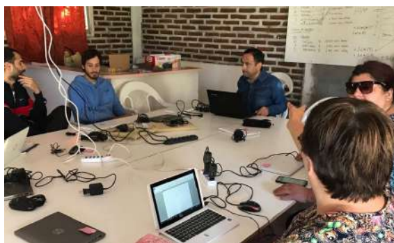
El curso de contabilidad se realiza en la sede de la Junta de vecinos de Guayacán.

Los otros 2 cursos pendientes Gestión de emprendimientos y Manejo de colmenas y apiarios, se espera iniciarlos durante el mes de marzo de 2019.