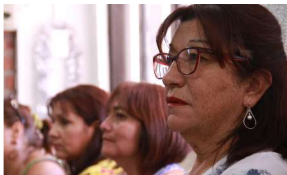
Más de 40 empresarios, especialmente, mujeres participaron de las actividades, charlas y seminarios.