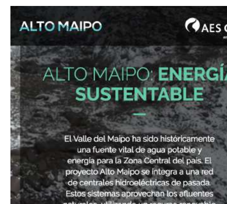
Desde noviembre se encuentra online esta página que viene a complementar la ya existente www.altomaipo.com .

Esta plataforma es una nueva iniciativa de Alto Maipo y AES Gener, que se suma a la página web www.altomaipo.com , para complementar de manera didáctica y directa los detalles de cómo se construye este proyecto país que tendrá una capacidad instalada de 531 MW.