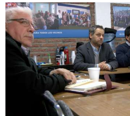
En la oportunidad, Saeig realizó una completa explicación respecto del plan el cual tiene un costo de 48 millones de dólares y se ejecutará en un período de 24 meses.

A través del sitio web, se puede explorar la profundidad de los túneles y caverna, informarse de los planes de rescate de fauna y de conservación del entorno natural, así como también, conocer los programas sociales que desarrollamos en conjuntos con los vecinos de San José de Maipo.