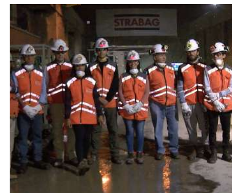
Los nueve jóvenes beneficiados con la Beca Aporte Alto Maipo que recorrieron las obras del proyecto.